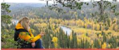
Näe & koe

strengths strengths strengths strengths strengths