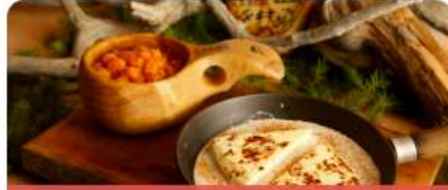
Syö & juo